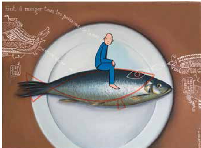
Philippe Hollevout Hareng , 2016 acrylique sur toile, 30 x 40 cm