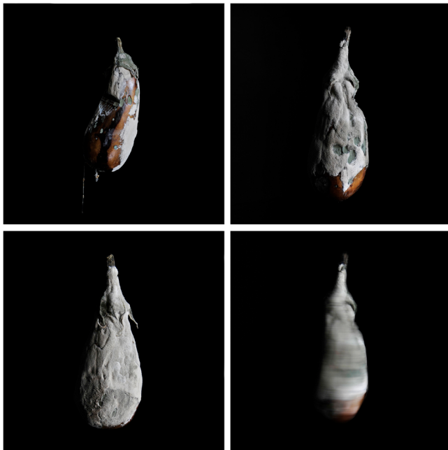
Delphine Lermite Série Légumes, Aubergine #1 à #4 , 2014 Tirage jet d'encre sur papier Fine Art Murakumo blanc