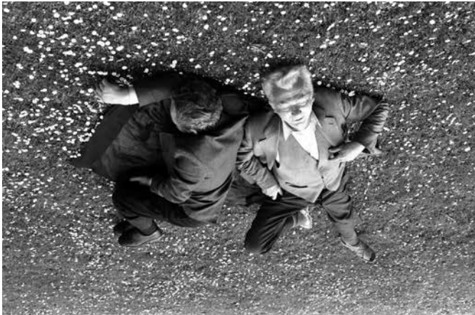
François Daumerie L'après déjeuner sur l'herbe , 2006 tirage barité, 40 x 50 cm