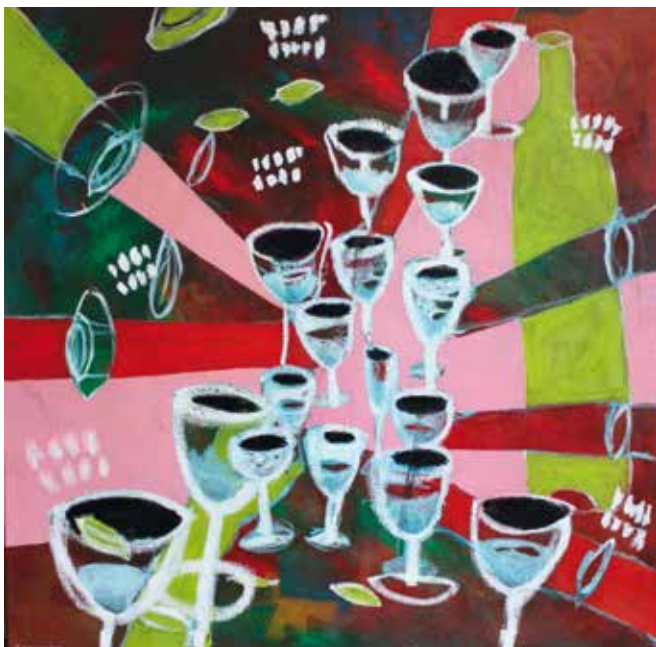
Gronoff Tchin Tchin , 2006 acrylique sur toile, 80 x 80 cm