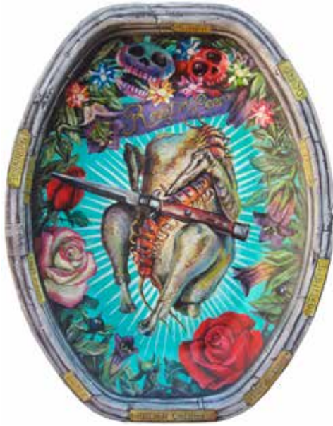
Chicken Kitchen , 2016 technique mixte