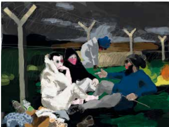
Jean-Pierre Dausset Le Déjeuner , 2016 digigraphie 1/1, 50 x 66 cm