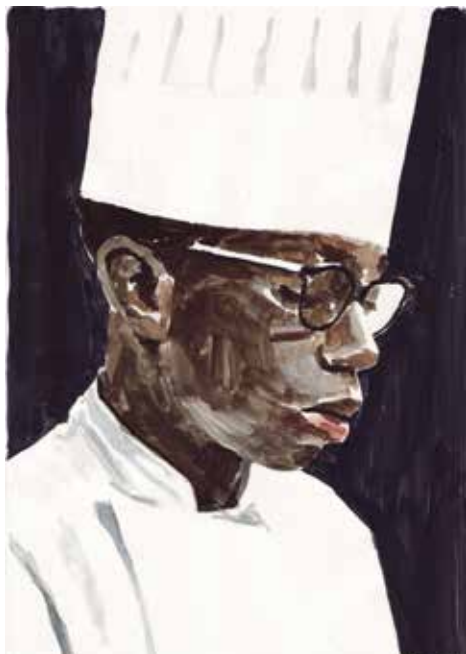
Sylvain Dubrunfaut Sans titre , 2006, gouache sur papier, 29,7 x 21 cm