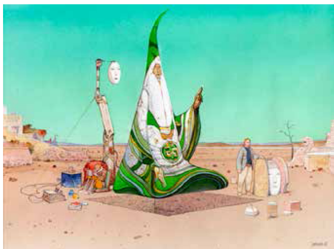
Moebius Lévitacion , 2006 digigraphie, 55 x 70 cm